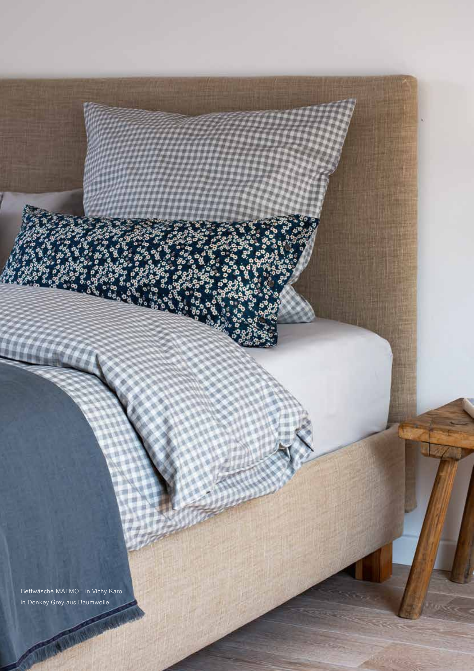
Bettwäsche MALMOE in Vichy Karo in Donkey Grey aus Baumwolle