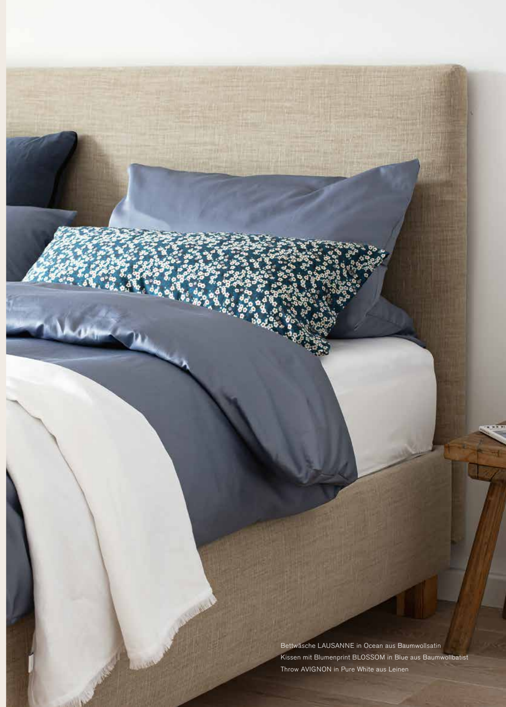
Bettwäsche LAUSANNE in Ocean aus Baumwollsatin Kissen mit Blumenprint BLOSSOM in Blue aus Baumwollbatist Throw AVIGNON in Pure White aus Leinen

STANDARD 135x200cm + 80x80cm KOMFORT 155x220cm + 80x80cm KISSENBEZUG 80x40cm