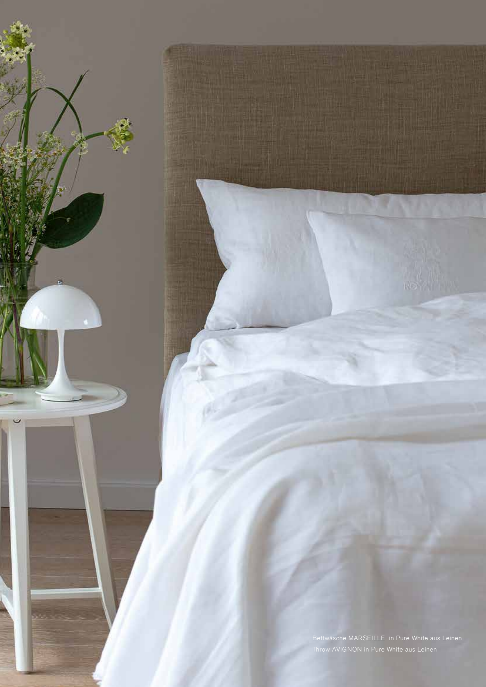
Bettwäsche MARSEILLE in Pure White aus Leinen Throw AVIGNON in Pure White aus Leinen