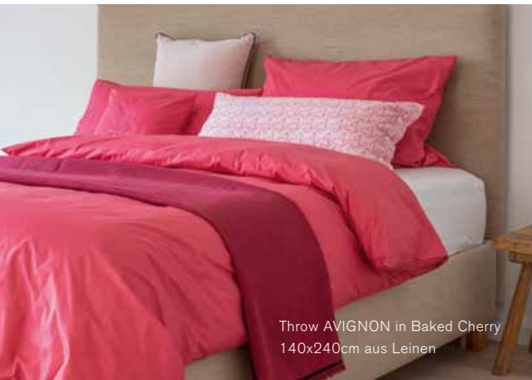
Throw AVIGNON in Baked Cherry 140x240cm aus Leinen

Die Throws sind an den Enden verziert. Sie sind mit einem edlen Samtband und einer feinen Kante aus Leinenfransen liebevoll handgearbeitet. AVIGNON ist in sieben Trendfarben erhältlich und lässt sich mit unserer Bettwäsche leicht kombinieren. Made in Hamburg. 140x240cm