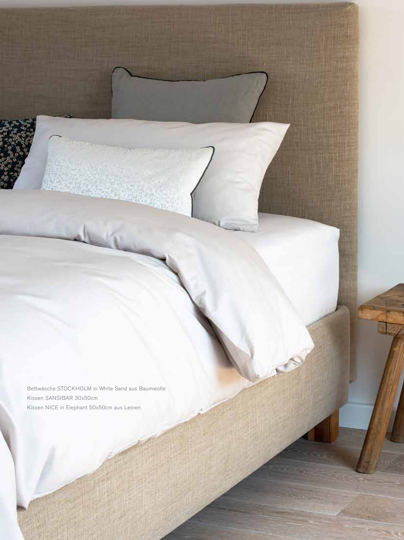
Bettwäsche STOCKHOLM in White Sand aus Baumwolle Kissen SANSIBAR 30x50cm Kissen NICE in Elefant 50x50cm aus Leinen

Unser Perkal ist aus 100% ägyptischer Baumwolle gewebt. Die Fasern, aus denen die Garne gesponnen werden, sind besonders lang und fein. Aus diesen hochwertigen Garnen werden dichte und feine Stoffe gewebt. Je höher die Anzahl der Fäden pro Inch, desto feiner ist die Qualität. Der Stoff muss mindestens 200 Fäden pro Inch haben, erst ab dieser Fadendichte darf er als Perkal bezeichnet werden. STOCKHOLM besteht aus 400 Fäden pro Inch.