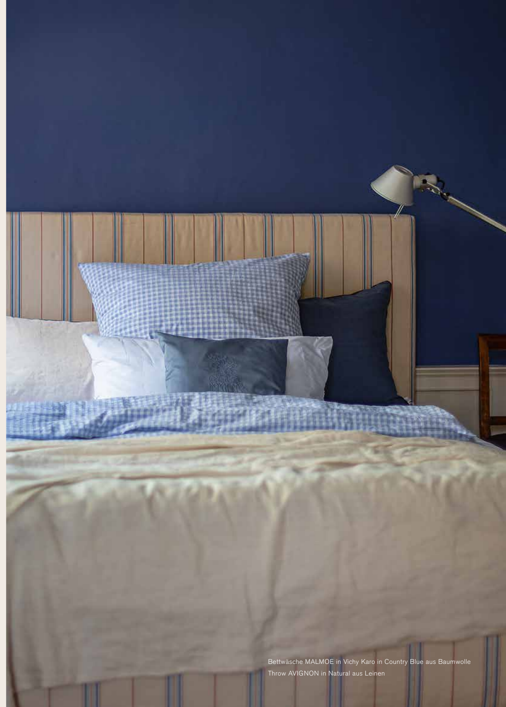
Bettwäsche MALMOE in Vichy Karo in Country Blue aus Baumwolle Throw AVIGNON in Natural aus Leinen