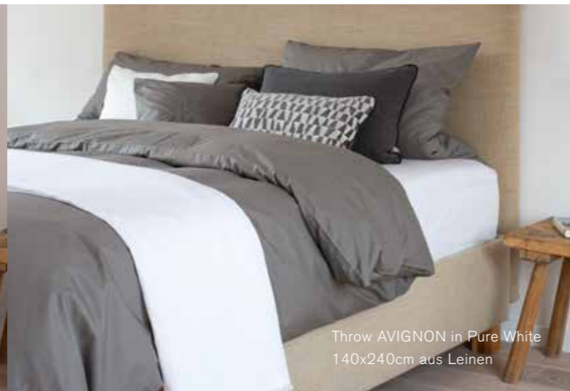
Throw AVIGNON in Pure White 140x240cm aus Leinen