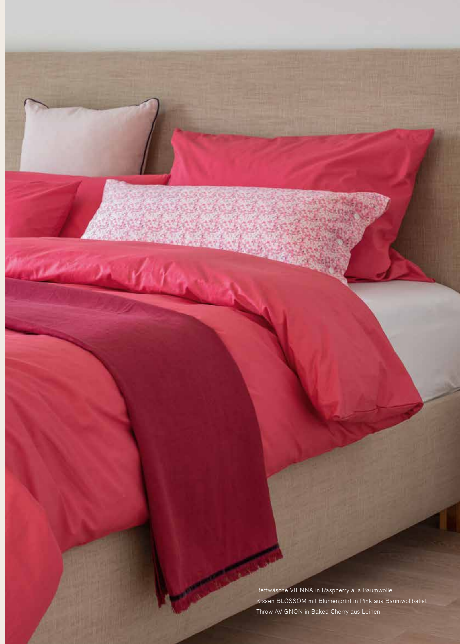
Bettwäsche VIENNA in Raspberry aus Baumwolle Kissen BLOSSOM mit Blumenprint in Pink aus Baumwollbatist Throw AVIGNON in Baked Cherry aus Leinen